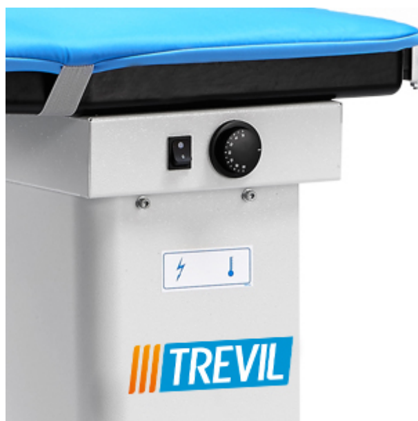
Regolazione della temperatura della superficie di stiratura