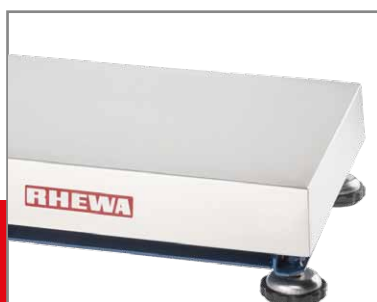
Edelstahl-Plattform 400 x 300 und 500 x 400 mm